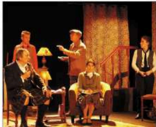
La compagnie l'éventail clôturera le festival dimanche avec une adaptation de La Souricière d'Agatha Christie.

Du rire et des frissons Les inconditionnels de théâtre de boulevard se presseront dès le premier soir devant une comédie grinçante mais amusante à souhait de la compagnie Y Sol en Scène : « Ah non ! La ménagère, elle est pour moi ! » . Les amateurs de frissons se détacheront eux d'une adaptation totalement libre des œuvres de Jules Verne : Moby-Du au club des Capotes ou de l'histoire mais très décalé : Re-