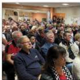
Près de 250 personnes étaient présentes à la réunion publique.

David Rachline : c'est une éventualité envisagée par l'Agglo et la Ville. Pas que pour ces travaux mais de façon générale. Notamment pour la saison estivale qui apporte des problématiques de circulation.