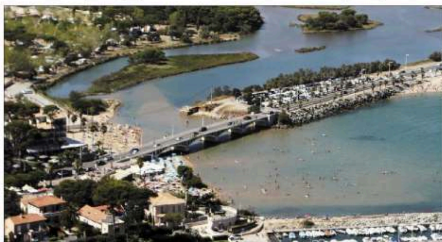
Les travaux de reconstruction du pont de la Galiote devraient démarrer en 2027.

L'option du pont à poutres précontraintes, dont le coût est estimé à 7 M€ HT, serait la moins onéreuse. En outre, celui-ci offrirait la meilleure durabilité et demanderait le moins d'entretien. Cependant, il s'agirait du plus long à construire (18 mois) et il faudrait couper la route pendant 8 mois. En outre, ses ancrages dans le grau (passage où les eaux de la mer et les eaux intérieures communiquent), plus imposants, ne faciliteraient pas l'écoulement des eaux lors d'épisodes de crues.