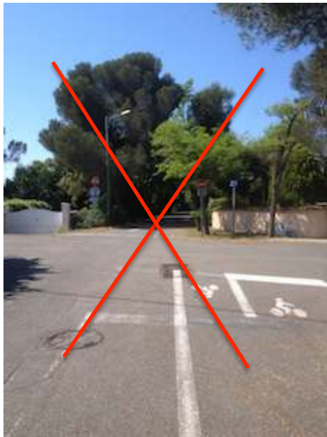
A proscrire car donne la priorité aux voitures