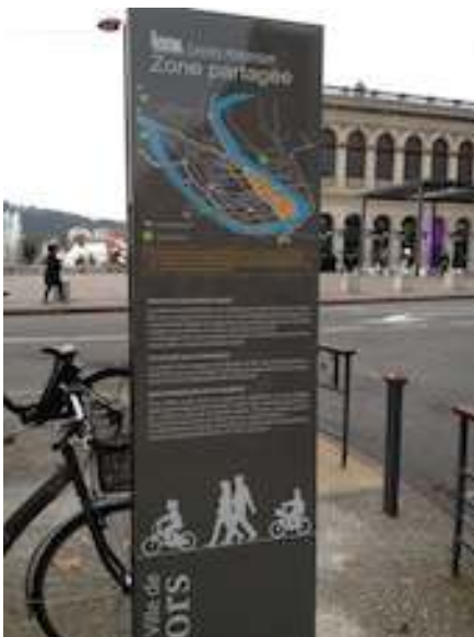
Ville de CAHORS : exemple de signalisation pour un espace apaisé en centre ville