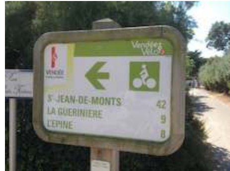
Signalisation repérée sur l'avenue du train des pignes