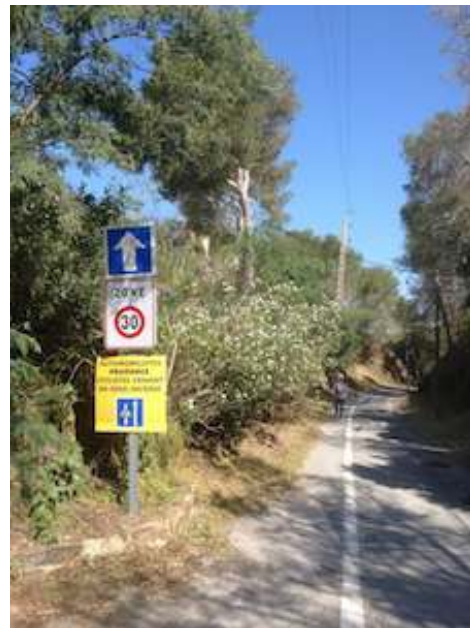
Quel espace pour les piétons ?